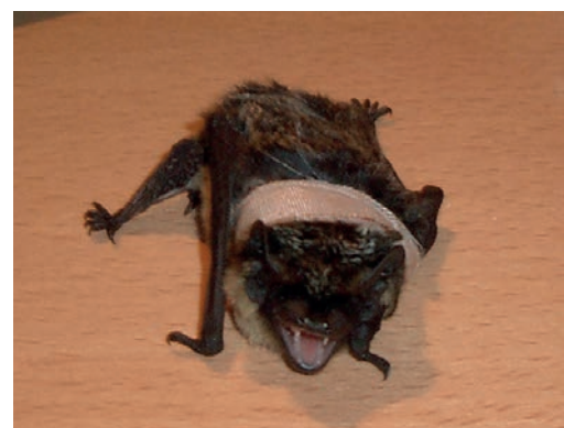
Patient im Fledermauskrankenhaus